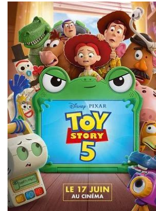
Animation - 1h42