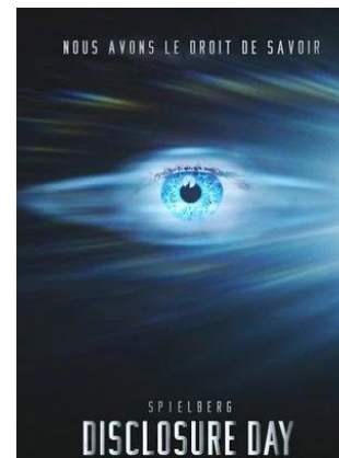
Science-Fiction - Thriller - 2h25