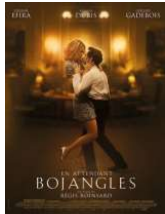
Comédie dramatique - 2h05

Camille et Georges dansent tout le temps sur leur chanson préférée Mr Bojangles. Chez eux, il n'y a de place que pour le plaisir, la fantaisie et les amis. Jusqu'au jour où la mère va trop loin, contraignant Georges et leur fils Gary à tout faire pour éviter l'inéluctable coûte que coûte.