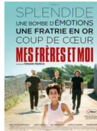
Drame - 1h48