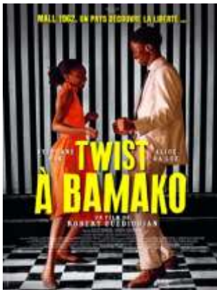
Drame - Historique - 2h 09